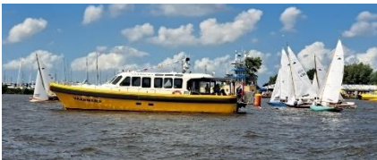
Vaarwens te gast bij de sneekweek 2024

De uitgebreide lunch wordt gedoneerd door de nicht. Het wordt een emotionele dag en niet alleen voor de familie maar ook voor mij; die weet hoe nooit de wond geneest, de wond die varen heet.